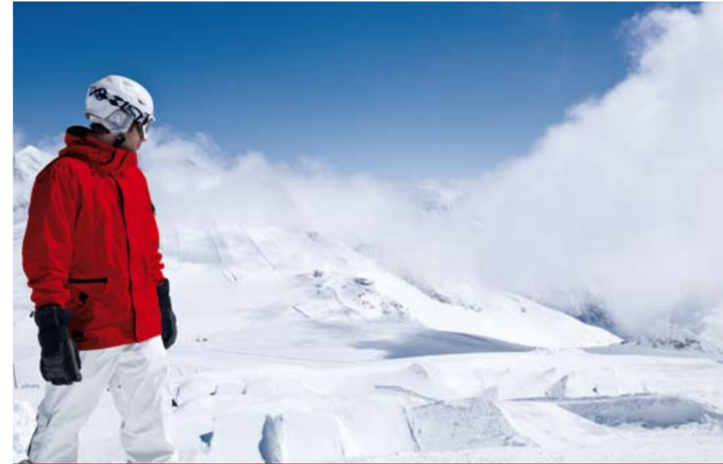
Sonnenstunden auf über 3.000 m

Skiroute Skirouten werden nur teilweise oder gar nicht präpariert, nicht kontrolliert, sind aber vor Gletscherspalten gesichert. Lawinewarndienste beachten!