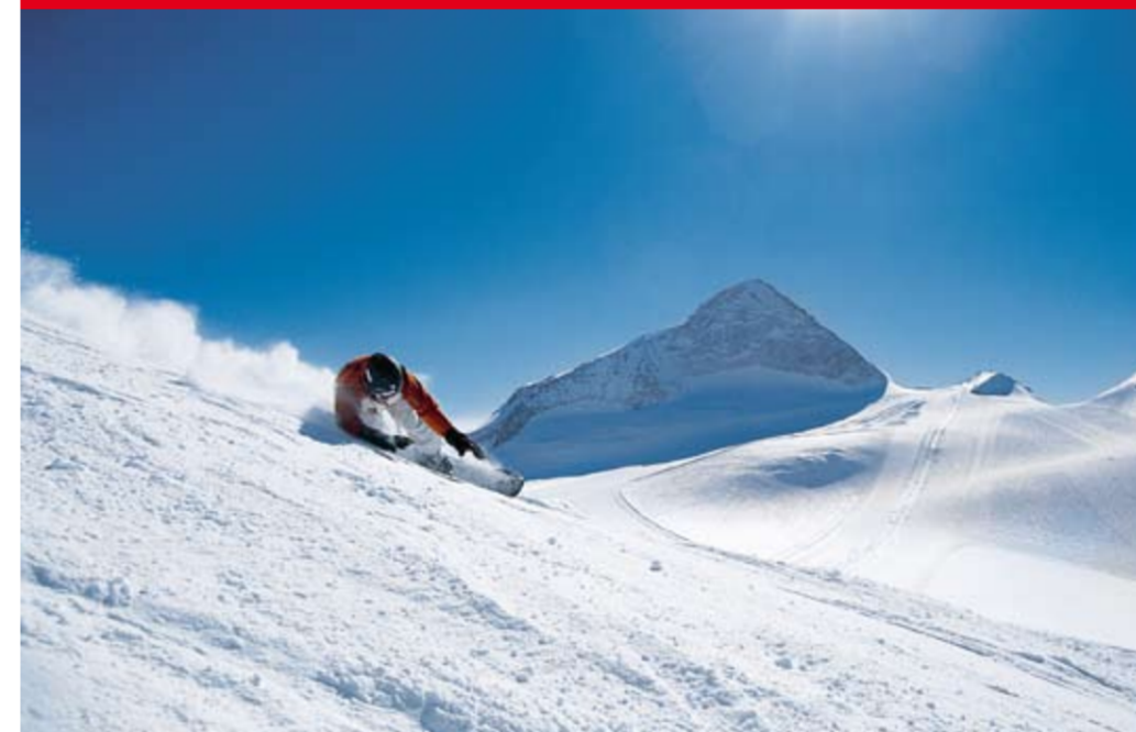
365 Tage im Jahr Wintersport